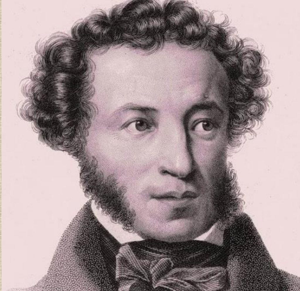
ПУШКИН АЛЕКСАНДР СЕРГЕЕВИЧ 1799-1837